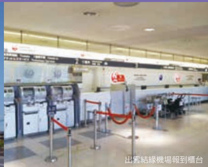
出雲結緣機場報到櫃台